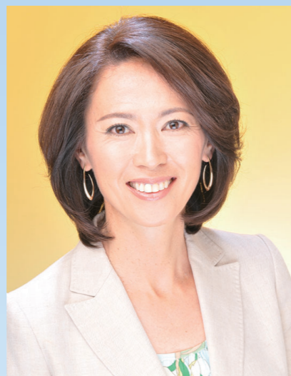
有森 裕子氏 元マラソン選手